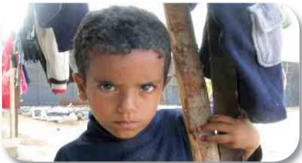
Un enfant de Gaza.

MARDI 2 FEVRIER à 18h30 à la MJC de CORBEIL-ESSONNES ●